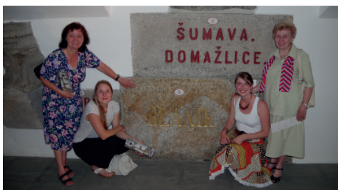
Focení u základních kamenů