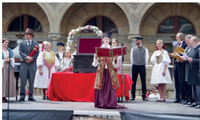
Hra o historii stavby Národního divadla a pokládání základních kamenů