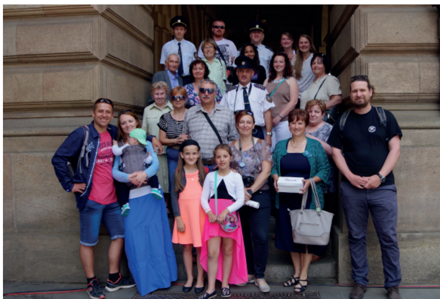
Účastníci zájezdu...