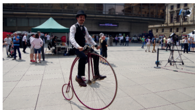
Program na náměstí Václava Havla