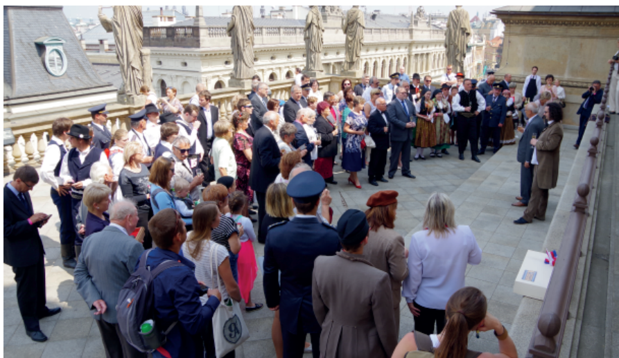
Uvítání zástupců obcí ředitelem Národního divadla na terase.