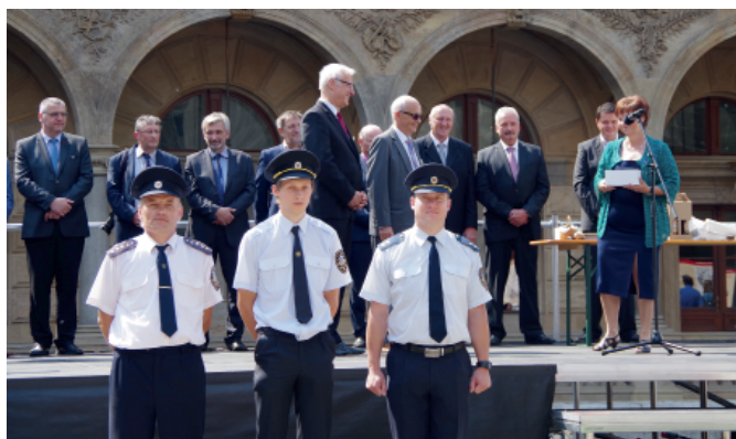
Předání symbolického kamene ministři kultury a řediteli divadla