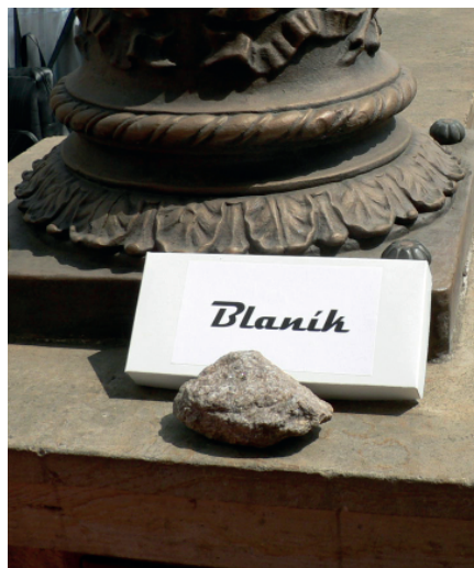
Malý symbolický kámen

Bylo nás tedy málo, ale vyjeli jsme. Paní starostka, na přání představitelů ND, vezla malý dárek- hezký kamínek z Blaníku. V divadle jsme byli přivítáni ve vstupní hale, vystoupali jsme po mnoha schodech až na horní ochoz ke krásným velkým sochám. Odtud byl pěkný výhled na Hradčany, Vltavu s lodčkami a sluncem osvětlenou část Prahy. Ve sklepení jsme snadno našli náš kámen se zlatým nápisem BLANÍK. Je jeden z největších základních kamenů. S úctou a pýchou jsme se ho dotýkali a vzpomínali na ty, kteří ho vylo-