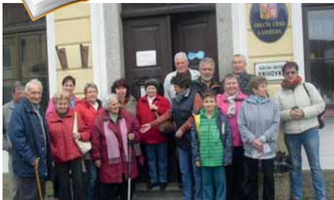
Návštěva muzea v Kamberce dne 12. 4. 2017.