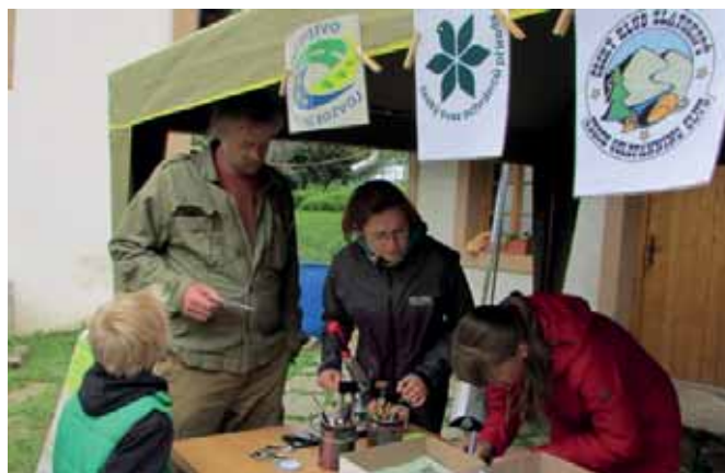
Fotografie a novinové výstřižky archiv a text Zdeněk Otradovec

vlastně položen kámen k této akci. Ve dnech 6. - 7. června 1987 zde proběhlo na Smršťově první mistrovství republiky v rýžování zlata. Účast byla velkolepá. Sešlo se asi 2000 zlatokopů a jejich přátel. Později se 1. června 1991 konala výstava, „Od zlatokopa k vědě a chráněná krajinná oblast“ na zámku Sokola Louňovice. Zároveň proběhlo VII. Mistrovství ČSFR v rýžování zlata.