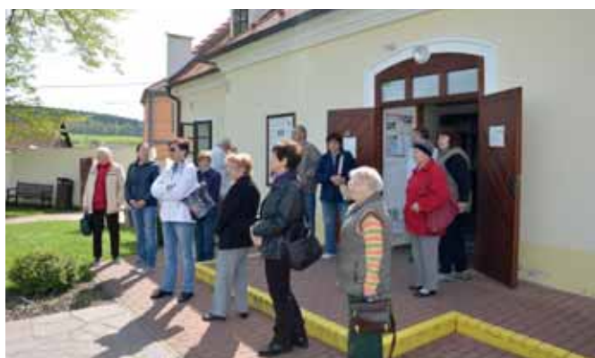
Návštěva fary v Kondraci a domu přírody u Krasovic dne 10. 5. 2017.