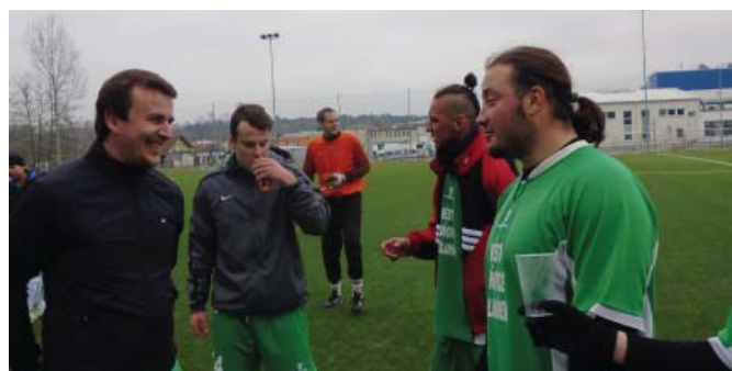
Zimní turnaj Vlašim