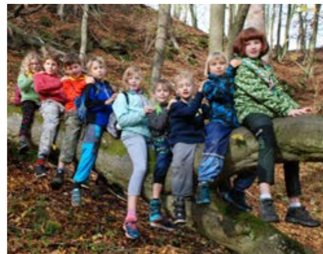
Na výpravě ve Vlastějovicích

Na konci října jsme se vydali na třídní výpravu do Vlastějovic v Posázaví. Tam jsme měli domluvené neobvyklé ubytování v upraveném železničním vagónu, který slouží jako klubovna místnímu spolku. Děti se nemohly nabažit pozorování projíždějících motoráček i nákladního vlaku a ochotný pan přednosta nás pozval do své kanceláře, kde nám ukázal, jak se řídí provoz ve stanici. My jsme se posléze vydali na pěší výlet podél Sázavy až na zříceninu hradu Chřenovice a z podhradí motoráčkem opět do „vagónku“. Starší kluci se večer chvíli věnovali rybaření, ale rybám se tentokrát na háček nechtělo, a tak se k večeri museli spokojit se špagetami. Následující den jsme kvůli špatnému počasí podnikli jen kratší výlet po okolí a jinak jsme hráli deskové hry a zdobili dýně. Oblíbenou listopadovou akcí je večerní hra po obci, kterou jsme pojmenovali „Louňovický dýňák“ a letos jsme ji připravili už potřetí. Děti (rozdělené do týmů po třech) musely najít domy se symbolem vyřezané dýně a u jejich obyvatel se pak pokusit o splnění nějakého zapeklitého úkolu – u Šikulky uhodnout hádanky, u Čerta vyjmenovat 10 stromů, Strážníka zajímal jejich znalost dopravních značek, Sládek testoval, jestli poznají předměty podle hmatu, ... Kromě toho na děti kdesi ve tmě čekala velká rozsvícená dýně, v jejíž blízkosti byl ukrytý poklad. Děkujeme všem ochotným sousedům, kteří nám se soutěží pomohli!