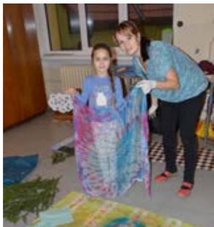
Tvoříme na jarmark I. třída