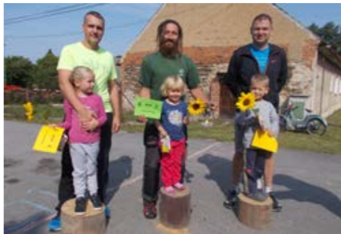
Vítězné týmy Koloběhu

Naši první akcí hned na začátku září byl louňovický Koloběh, určený nejen pro naše členy, ale i pro děti a rodiče z celé obce a okolí. Letos jsme pořádali již druhý ročník a byli jsme mile překvapeni počtem startujících dvojic, kterých bylo 22. Úkolem soutěžících bylo zvládnout okruh dlouhý 1 kilometr v co nejkratším čase, přičemž každá dvojice měla k dispozici jedno kolo. Děti do šesti let závodily vždy s někým dospělým (nejčastěji rodičem), starší děti pak ve dvojici s kamarádem či sourozencem. Odměnou pro vítěze každé kategorie byl putovní pohár a pro všechny pak nejrůznější domácí dobroty jako chlebičky, palačinky a vafle. Ještě jednou děkujeme všem, kteří pomáhali se zajištěním trasy závodu a přípravou občerstvení.