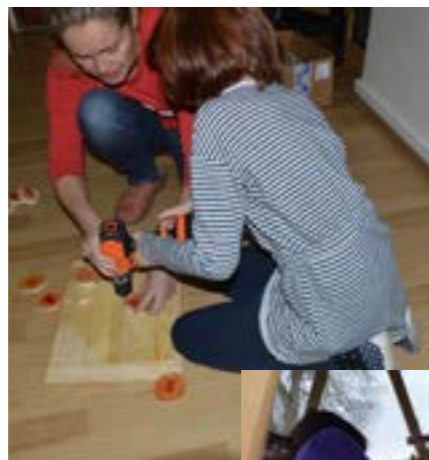
Tvoříme na jarmark II. třída

Čas přání, sblížení a setkávání se opět po roce nachýlil. Kouzelnou atmosférou žije i naše škola. Všude voní sušené ovoce, okna se odívají do něžných sněhových krajků a dětské prstíky nadšeně tvoří dárečky pro potěšení nejen svých blízkých. Žáci si měli možnost vyzkoušet řadu technik i práci s nejrůznějšími materiály