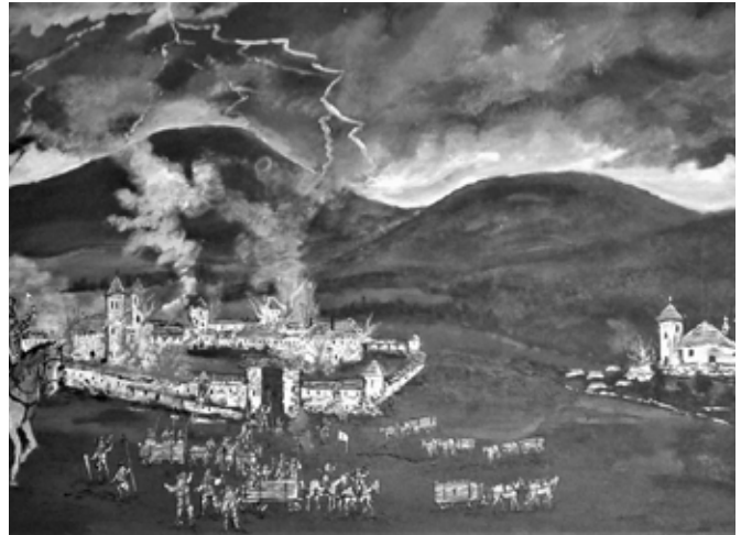
obraz: Josef Vrána