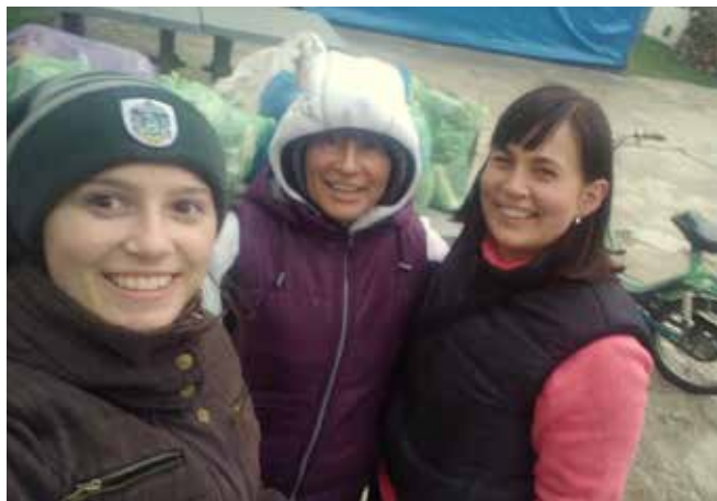
Sběr odpadu