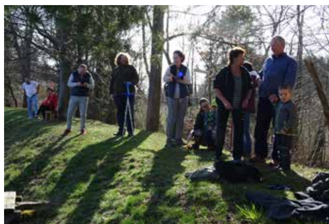
Odemykání rybníka - foto: Josef Průcha