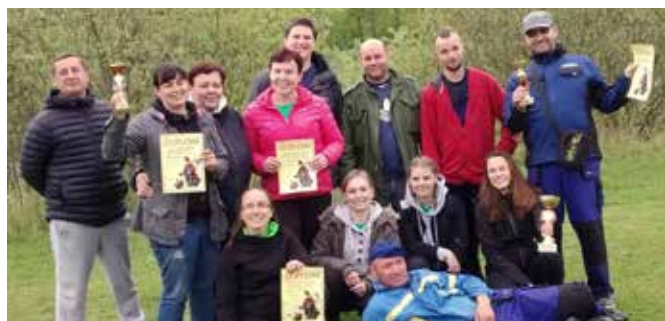
Okrsková hasičská soutěž, družstvo Býkovice