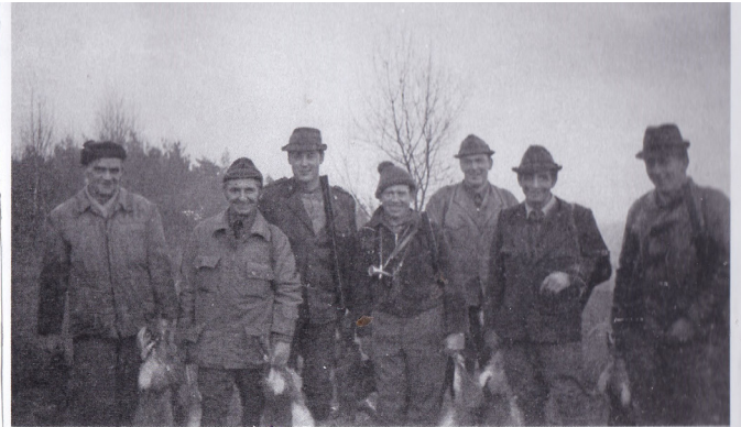
MS LIBOŮŇ - HON V LABECH 1973