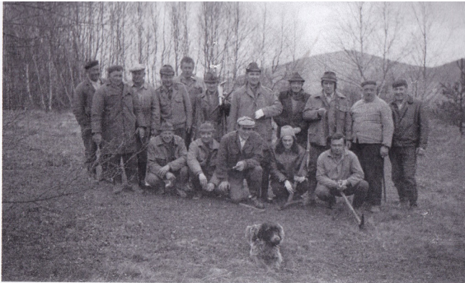
SRIGÁDA NA SÁZENÍ STROMCŮ LABY 1972