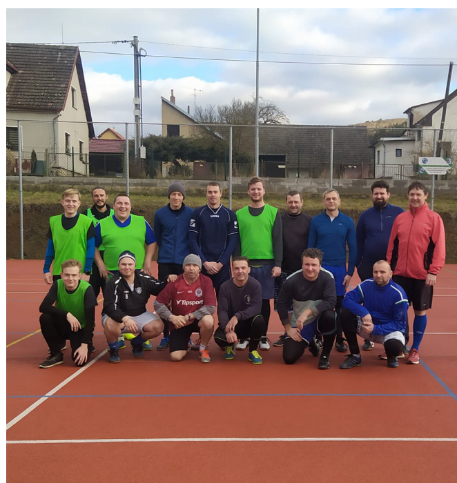
Silvestrovský fotbálek