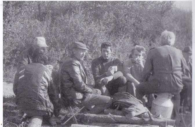
MS LOUŇOVICE 1986 výlov myšička