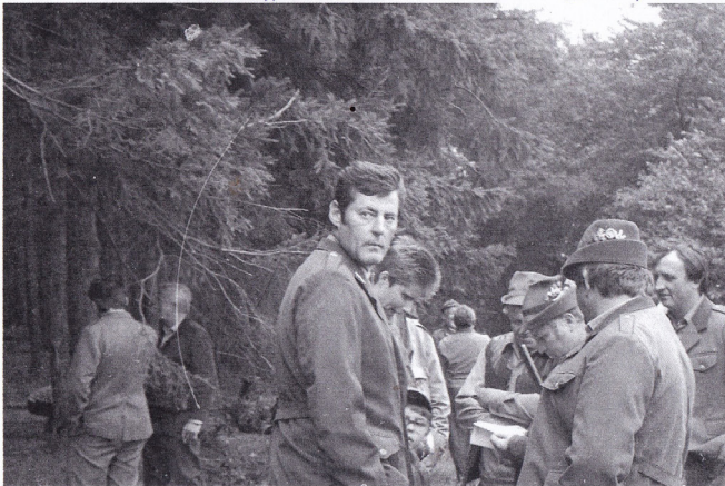
Na honě v Boveně MS Louňovice 1985