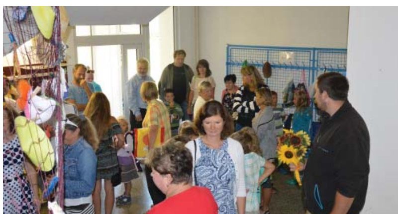
Zahájení školního roku