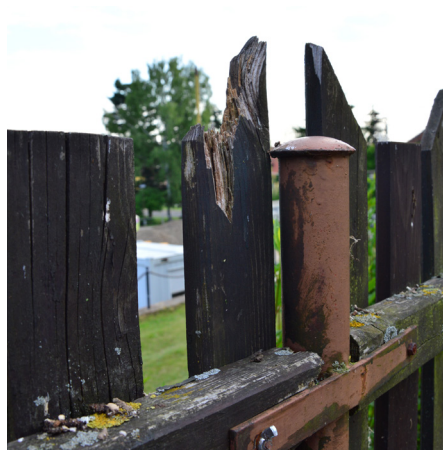
Před rekonstrukcí plotu; Foto: Lucie Sedláková