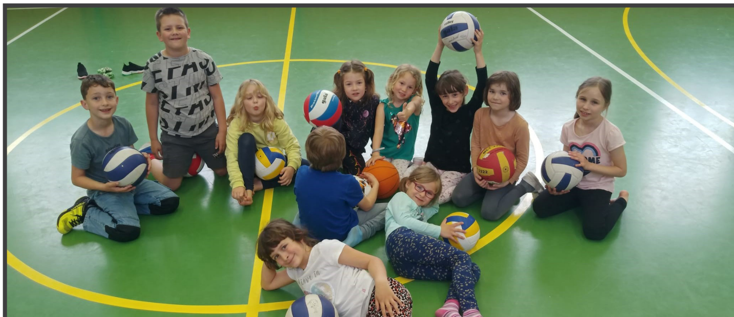
První rok všestranného cvičení pro mladší žactvo za námi.; Foto a text: Lenka Tichá