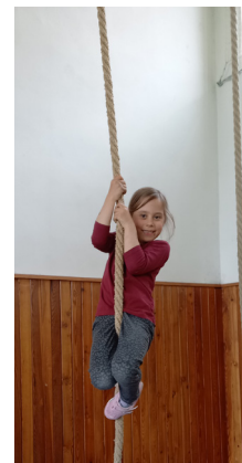
Skončil nám druhý rok cvičení s předškoláky. S dětmi jsme od září stihli spoustu aktivit a moc jsme si to užili.