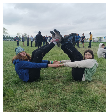
Národní skautské jamboree 2023