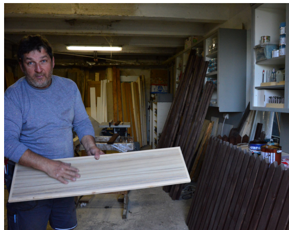
Truhlářská dílna obce