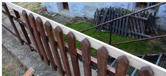
Nový plot u pošty