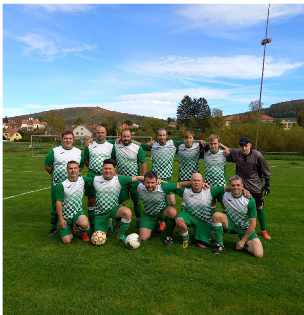
IV. třída skupina B – konečná tabulka 2022/2023