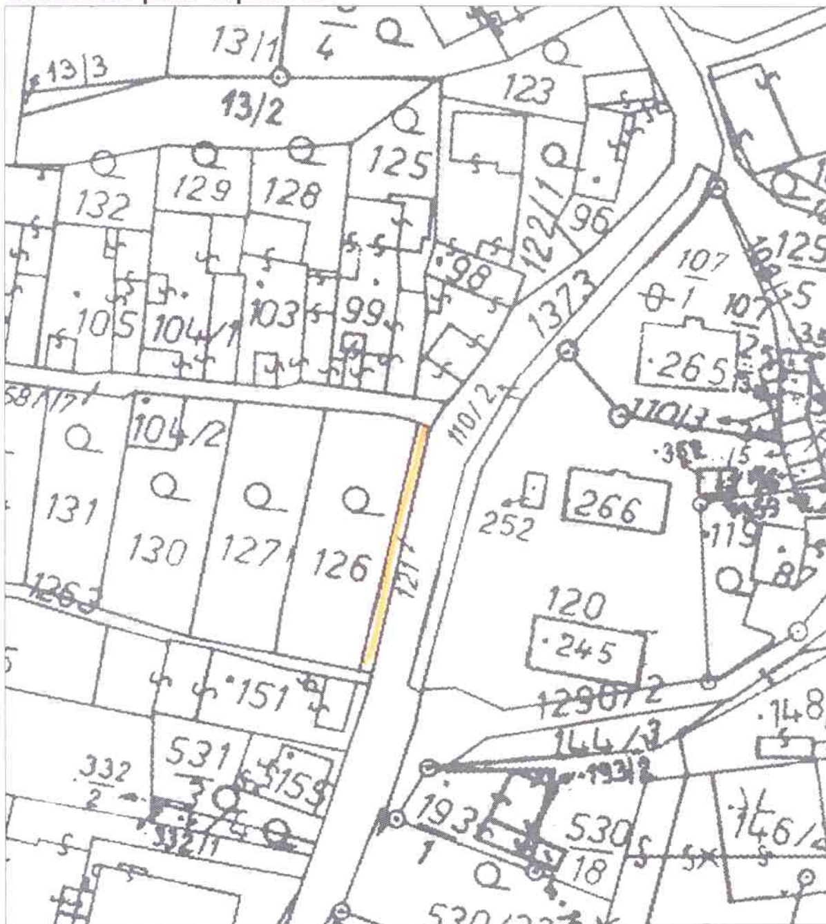
Mapa v měřítku 1:1000