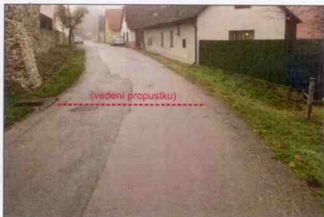
Propustek 1c - staničení 0,143 - celkový pohled