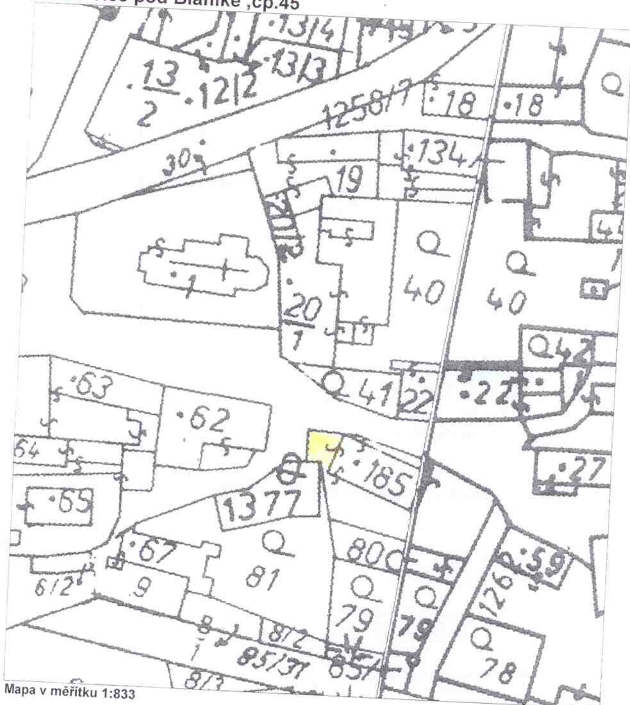
Mapa v měřítku 1:833