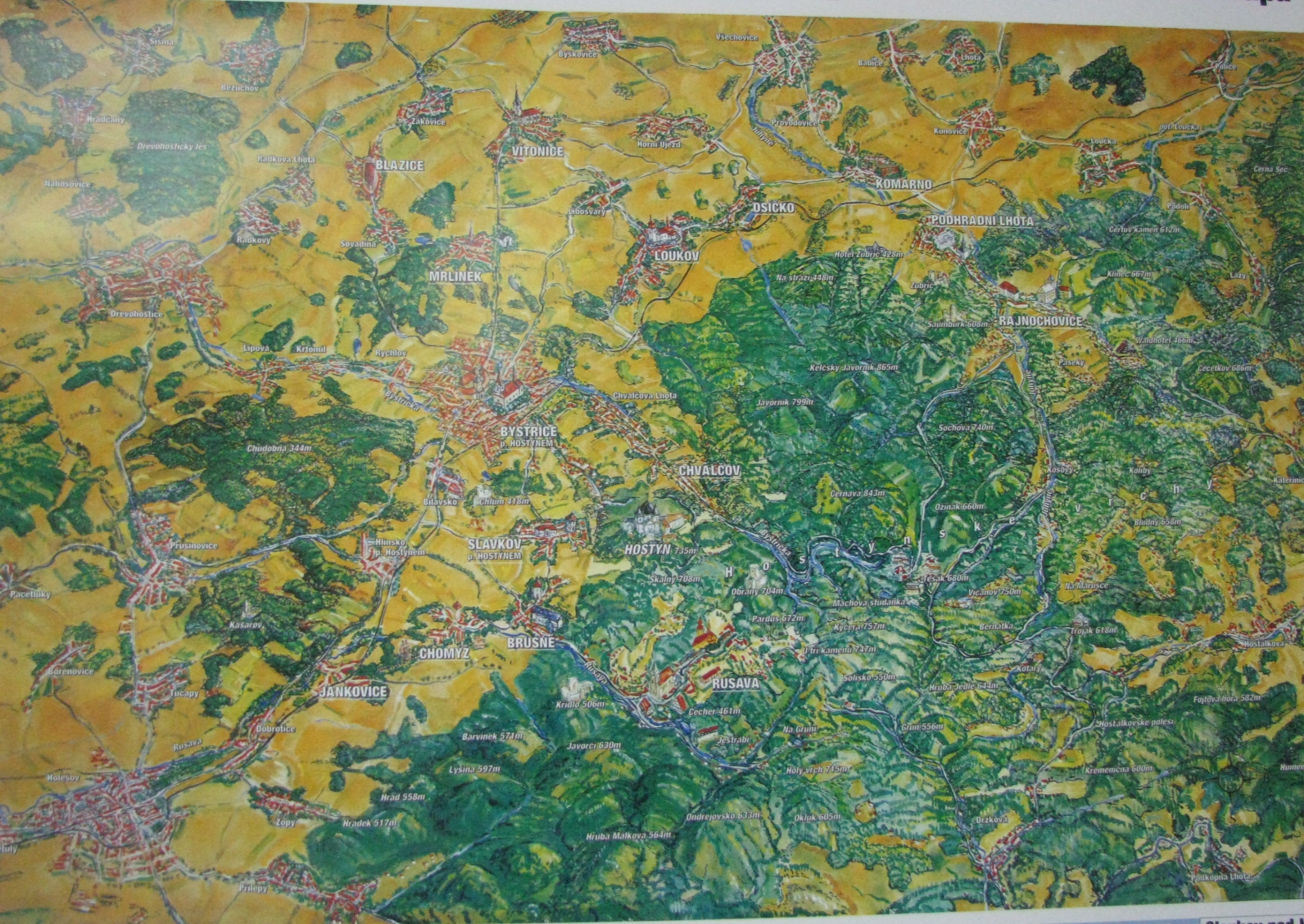
Historická turistická hornatina je po svých okrajích lemována